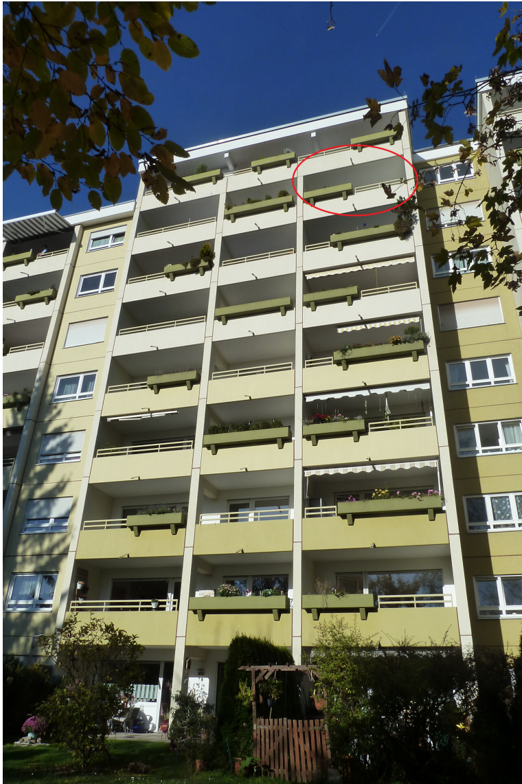
Haus Nr. 8 Westansicht