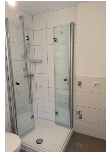
Bad mit Waschmaschinenanschluss