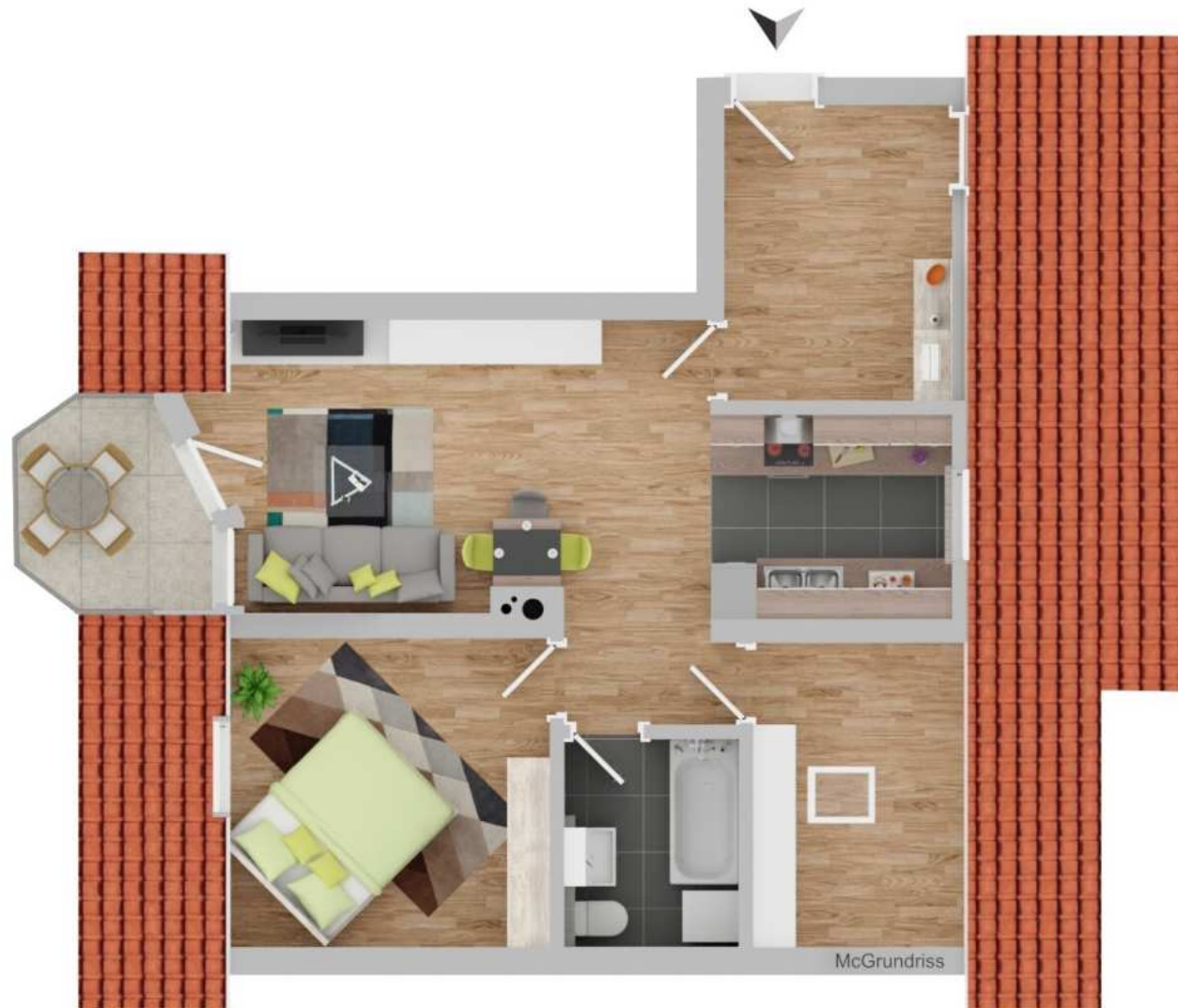
Grundriss nicht maßstäblich