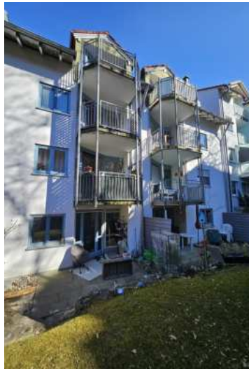
Balkone nach Westen