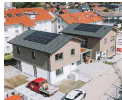
Mein Zuhause in Durach-Weidach 1 Kettenhaus