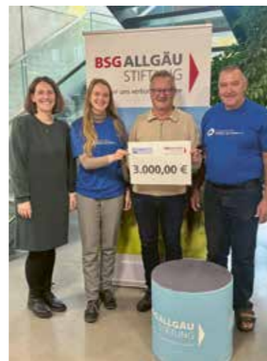
Spendenübergabe an den Förderverein Freibad Seltmans

Mit weiteren 2.000 Euro möchte die BSG-Allgäu Stiftung im wahrsten Sinne des Wortes Trost spenden – mit dem Trösterbären Benny. Benny ist ein Markent Teddy, der Kindern nach einem Unfall oder traumatischen Ereignis übergeben wird. Seit fast 20 Jahren versorgt der Verein Kleine Patienten in Not e.V. Krankenhäuser, Rettungsdienste, Feuerwehren, Polizeidienststellen und Notfallseelsorger*innen in ganz Deutschland mit den sogenannten Bennys. Und das mit Erfolg: Die Kuscheltiere trösten über den ersten Schmerz und Schreck hinweg, beruhigen die in Not geratenen Kinder und helfen bei Diagnose- oder Aufarbeitungsgesprächen.