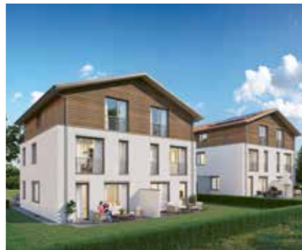
Daheim auf der Halde. Stadtnah. Im Grünen.

4 Reihenhäuser in Holzbauweise mit massivem Kellergeschoss