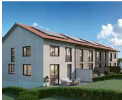
Daheim auf der Halde. Stadtnah. Im Grünen.

4 Reihenhäuser in Holzbauweise mit massivem Kellergeschoss