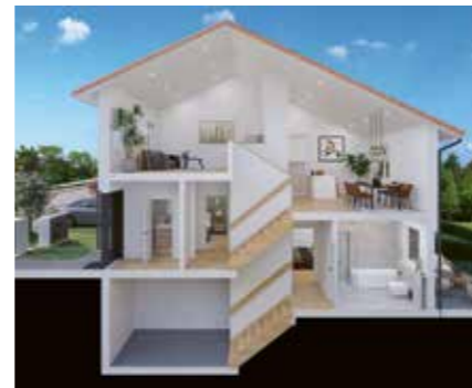
Daheim auf der Halde. Stadtnah. Im Grünen. Modernes Wohnen auf versetzten Ebenen

2 Doppelhäuser "Junge Familie" in Massivbauweise