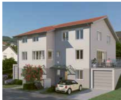
Mein Zuhause in Sulzberg 1 Doppelhaus an der Sonthofener Straße