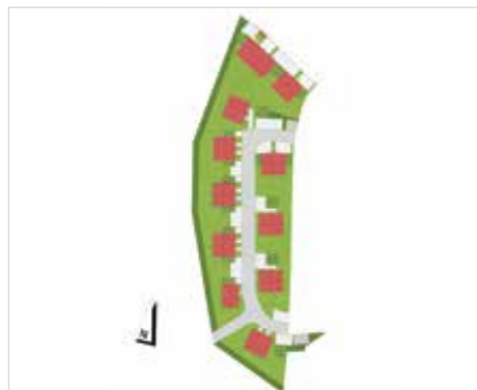
im Grünen zuhause – die Stadt ganz nah 9 Doppelhäuser in Massivbauweise in Kempten-Neuhausen