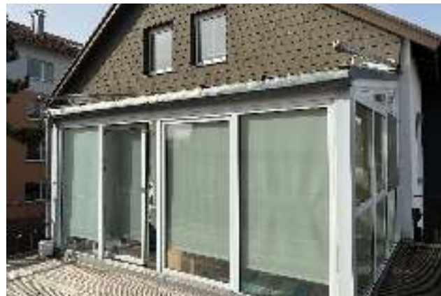
Blick auf Wintergarten