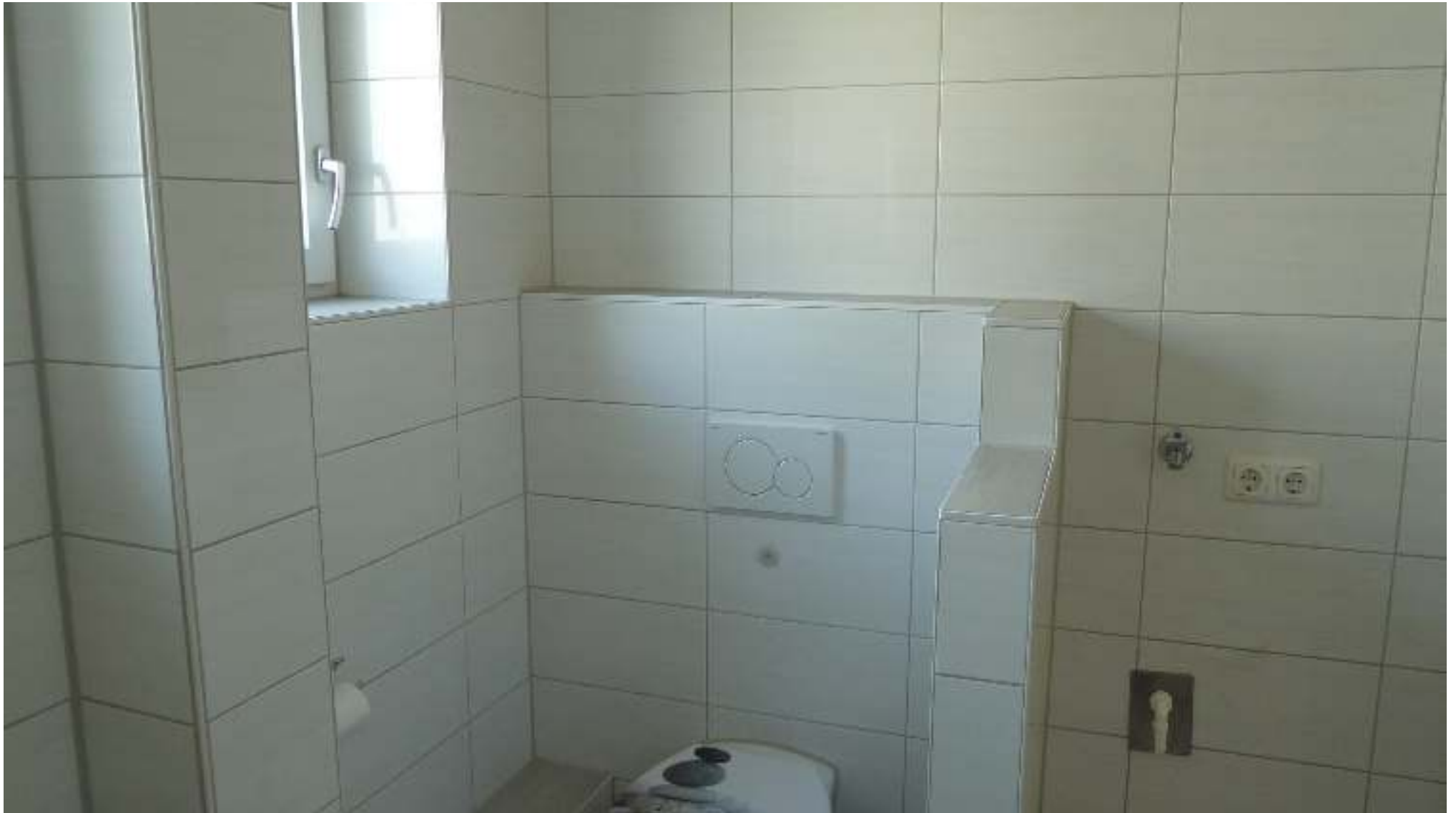
Bad mit Waschmaschinenanschluss