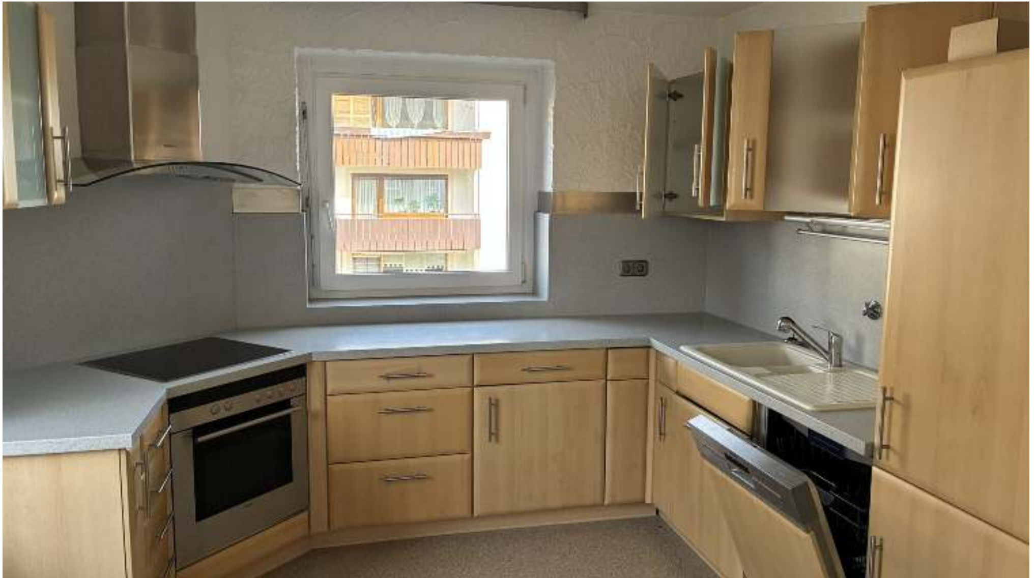
EBK inklusive - ohne Kühlschrank