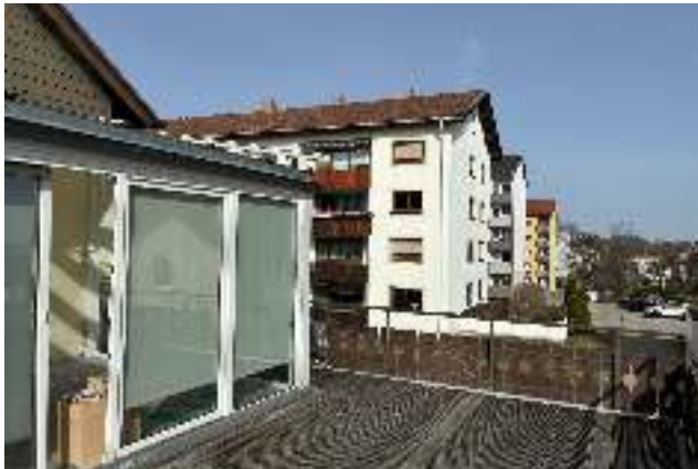
Dachterrasse auf Garage