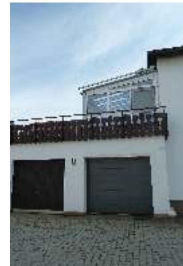
rechte Garage inklusive