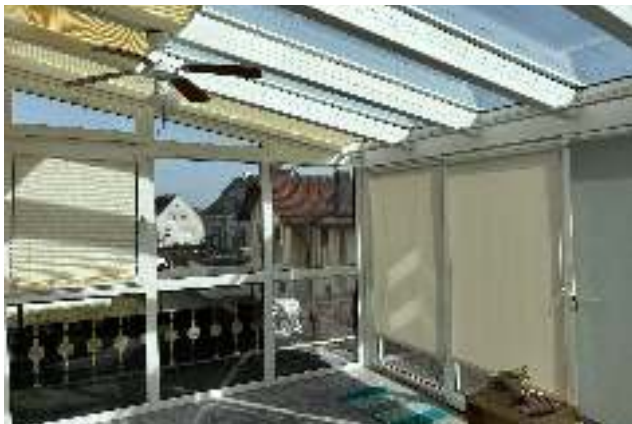
Wintergarten innen - Kaltraum