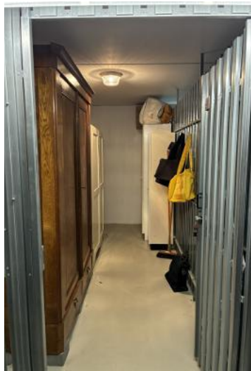
Kellerraum mit Stromanschluss