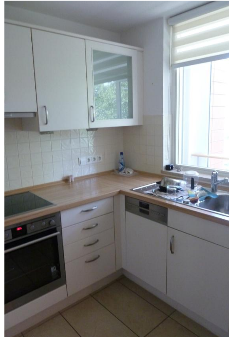
Küche mit Tageslicht