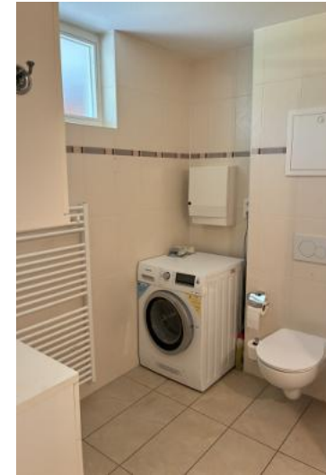
Bad mit Waschmaschinenanschluss