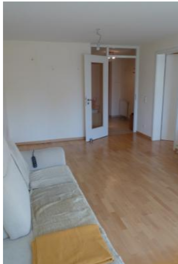
Wohnzimmer Blick Diele